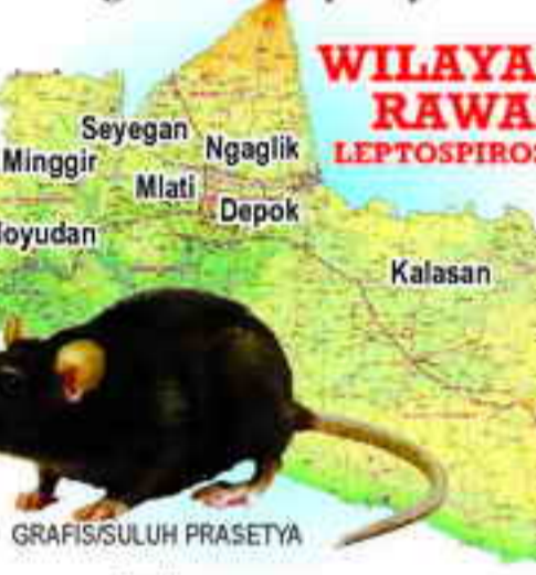
WILAYAH RAWAN LEPTOSPIROSIS

Menurutnya, saat ini masyarakat di wilayah pertanian justru lebih siap menghadapi penyebaran penyakit ini. Pasalnya masyarakat sudah terbiasa dan sangat mengenal penyakit